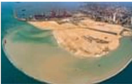
இலங்கையில் சீனாவின் தீவு... எய்யுச் சமாளிக்கப் போகிறது இந்தியா?

ஒரு கிலோ உளுந்து இந்திய மதிப்பில் 400 ரூபாய்க்கு விற்பனையாகிறது. அந்த விலைக்கு விற்றாலும் கடும் தட்டுப்பாடு நிலவுகிறது. சிறுதானியங்கள், அரிசி அனைத்திற்கும் கடுமையான தட்டுப்பாடு நிலவுகிறது. அதன் காரணமாக விலையும் அதிகரித்துக் கொண்டே போகிறது. 100 கிராம் மஞ்சள் இந்திய மதிப்பில் 300 ரூபாய்க்கு விற்பனையாகிறது.